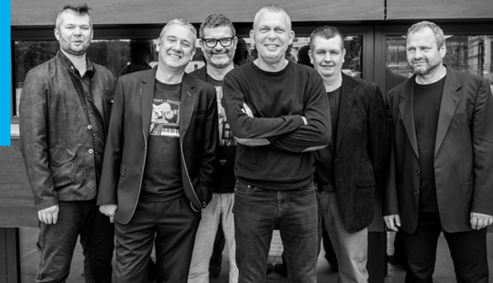
RAZ DWA TRZY

RAZ DWA TRZY „Człowiek czasami serce otworzy”