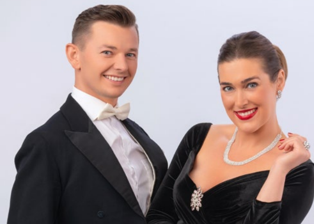
KARNAWAŁOWA GALA OPERETKOWA