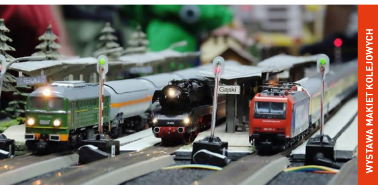
WYSTAWA MAKIET KOLEJOWYCH

3 grudnia (niedziela), g. 17.00 Scena NCK 6 grudnia (środa), g. 9.00, 11.45 i 17.00 7 grudnia (czwartek), g. 9.00 i 11.45 Każdy mieszkaniec sklepu z zabawkami marzy o tym, by stać się prezentem mikotajowym. Pewnego dnia na półkę trafia pan Antenka, którego piękny, srebrny kubraczek przyciąga wzrok. Zazdrosne zabawki postanawiają pozbyć się intruza. Spektakl zakończy spotkanie ze Świętym Mikołajem, który rozda dzieciom zakupione przez opiekunów prezenty. spektakl dla dzieci powyżej 4 lat bilety: 35-40 zł