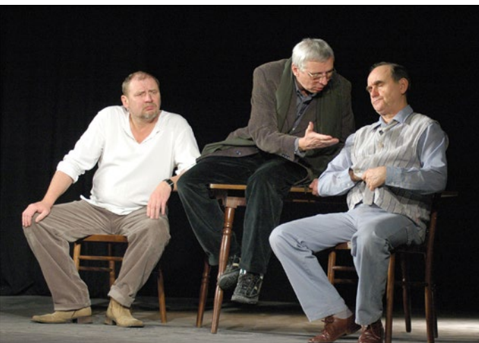
SCENARIUSZ DLA TRZECH AKTORÓW