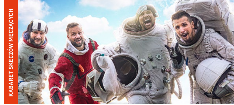
KABARET SKECZÓW MĘCZĄCYCH