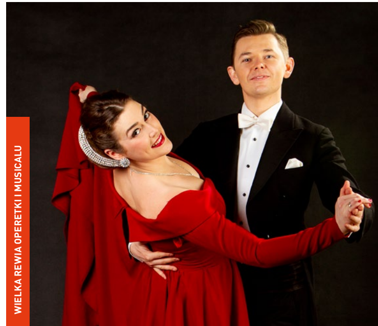
WIELKA REWIA OPERETKI I MUSICALU