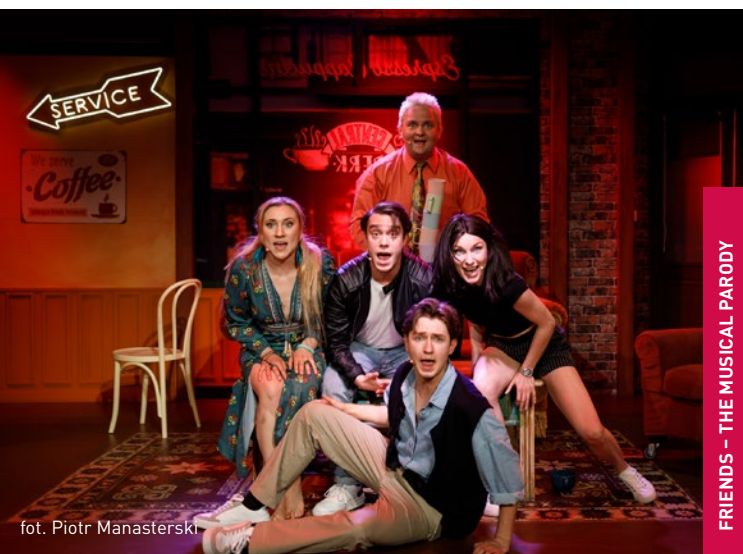
FRIENDS – THE MUSICAL PARODY