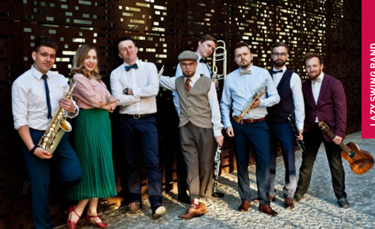
LAZY SWING BAND