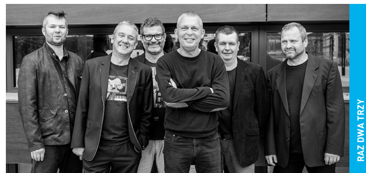
RAZ DWA TRZY