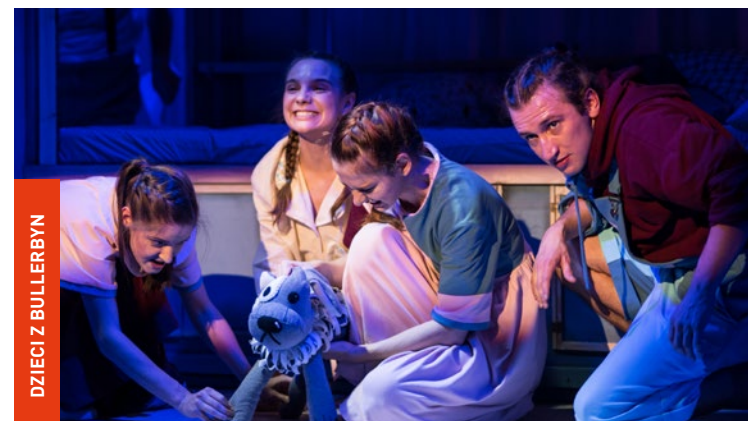
DZIECI Z BULLERBYN