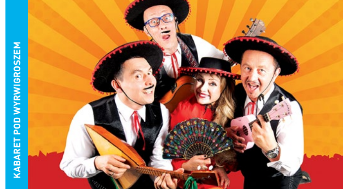
KABARET POD WYRWIGROSZEM