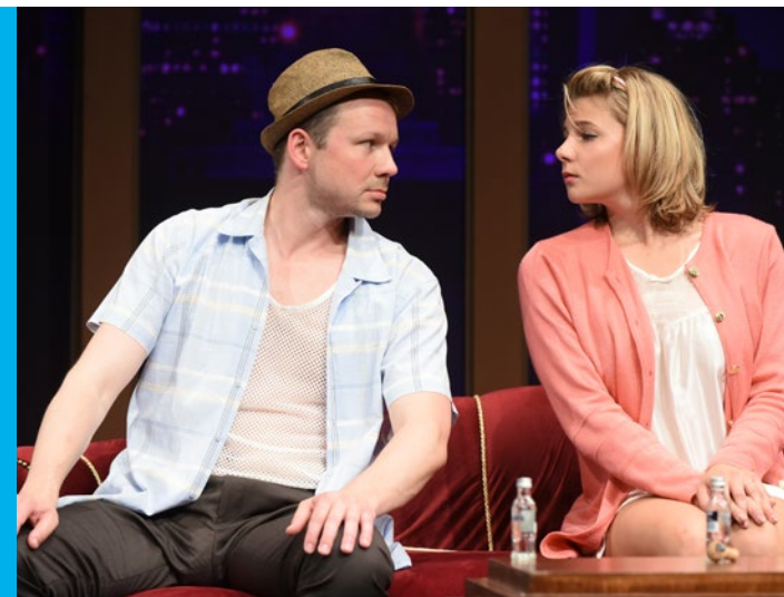
DWIE PARY DO PARY