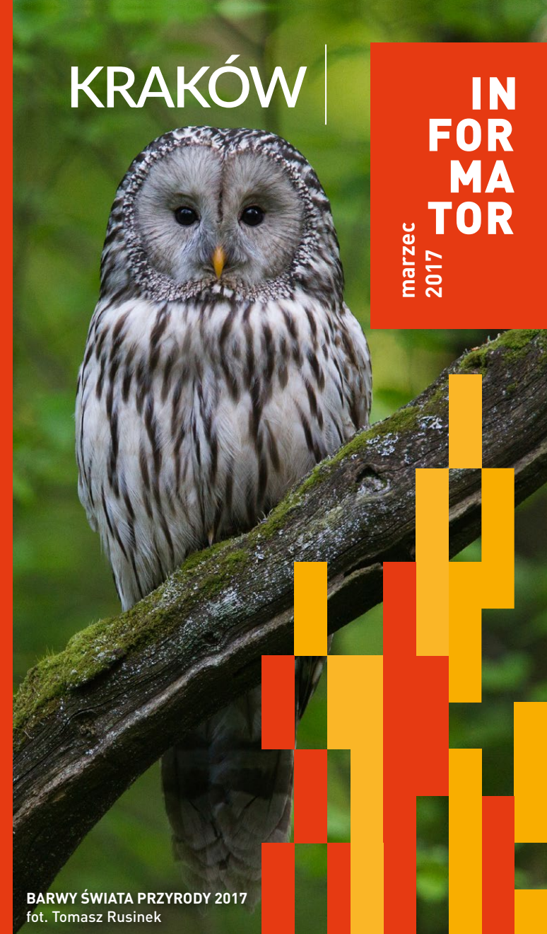
BARWY ŚWIATA PRZYRODY 2017