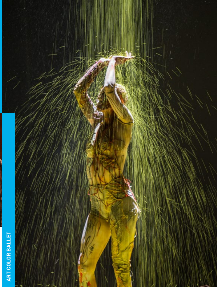
ART COLOR BALLET