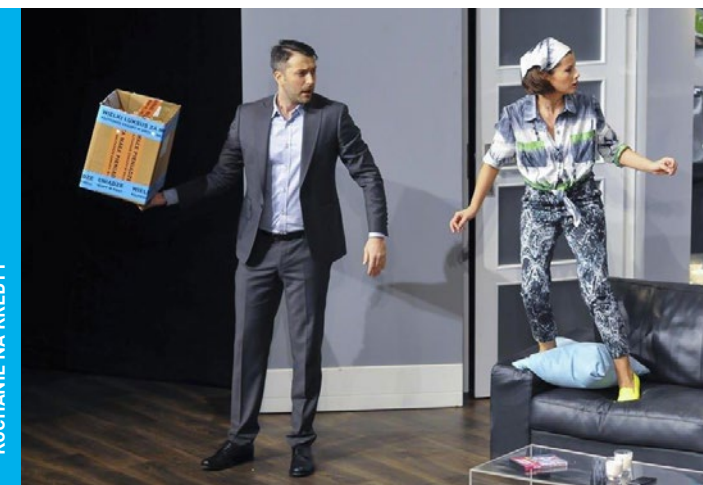
KOCHANIE NA KREDYT